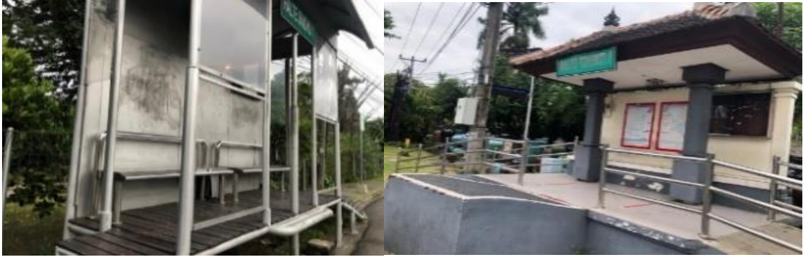
Gambar 3. Kondisi Bangunan Halte Bus Trans Sarbagita