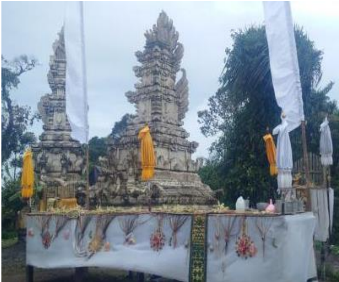
Gambar 1. Pura Sebagai Potensi Spiritual Desa Bukit

Potensi budaya adalah potensi yang tumbuh dan berkembang di masyarakat baik itu adat istiadat, kesenian, dan budaya. Dengan budayanya Desa Bukit memiliki tari Kupu-Kupu Kuning dan tari Sraman yang mempunyai sejarah tentang peperangan pada jaman Kerajaan Karangasem. Dari sisi adat istiadat adalah perpaduan dua budaya antara masyarakat yang beragama Hindu dan Muslim yang ada di desa Bukit. Salah satunya yaitu warga Islam wajib menabuh bende (gong kecil) di setiap piodalan di Pura Bukit (NusaBali.com, 2019). Potensi ini merupakan hasil olahan sumber daya alam menjadi produk makanan ataupun kerajinan sekaligus menjadi sebagian mata pencaharian masyarakat Desa Bukit. Potensi ini terdiri industri minyak kelapa, kerajinan ate dan budidaya lebah.