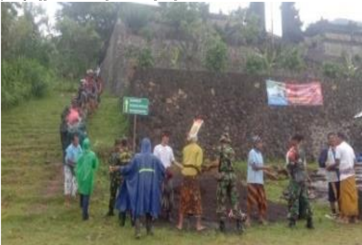
Gambar 5. Bentuk Partisipasi Masyarakat Dalam Pembangunan Jalur Tracking

Berdasarkan prinsip pengembangan desa wisata, sudah ada keterlibatan masyarakat seperti menyediakan fasilitas dan sarana wisata yang layak bagi wisatawan. Melalui tersedianya paket wisata, guide tour dan pekerja di setiap kegiatan melibatkan masyarakat lokal. Selain itu masyarakat sudah ikut membantu dalam pembuatan Seribu Tangga Bahagia yang dijadikan jalur trekking sebagai daya tarik wisata. Hanya saja masih sedikit masyarakat yang mampu melakukan inovasi untuk meningkatkan daya tarik desa. Tidak semua kegiatan pengembangan dapat dilaksanakan oleh masyarakat desa, salah satunya yaitu penggunaan teknologi ramah lingkungan.