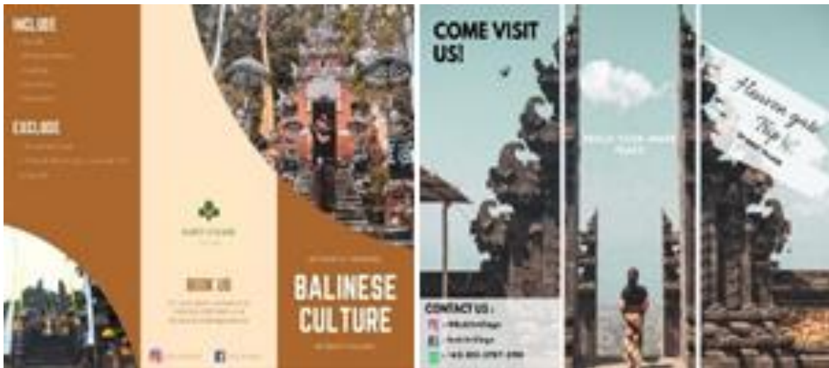
Gambar 4. Bentuk Promosi Wisata Desa Bukit