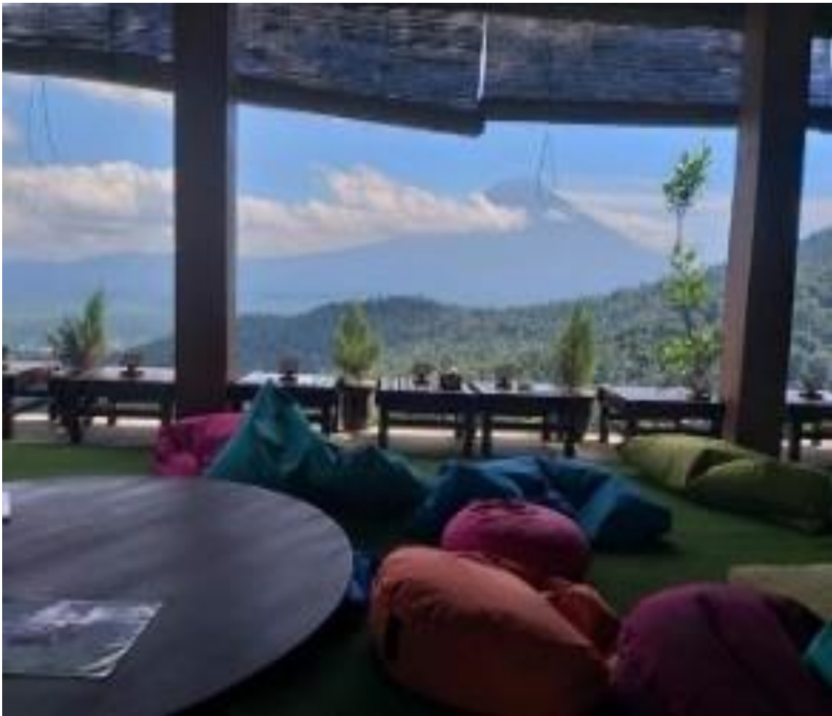
Gambar 3. Produk Wisata Unggulan Desa Bukit

Ketuntasan dalam perencanaan pada daya tarik wisata yang sudah dilakukan yaitu menjadikan potensi alam sebagai produk wisata dalam bentuk restaurant dan spot foto, potensi yang belum terkemas dijadikan paket wisata, pembangunan seribu tangga bahagia sebagai daya tarik spiritual dalam bentuk jalur tracking sekaligus sebagai akses menuju Pura Sad Kahyangan . Jika dilihat dari ketersediaan komponen, maka masih sedikit ragam budaya dan seni khas desa yang dijadikan daya tarik desa.