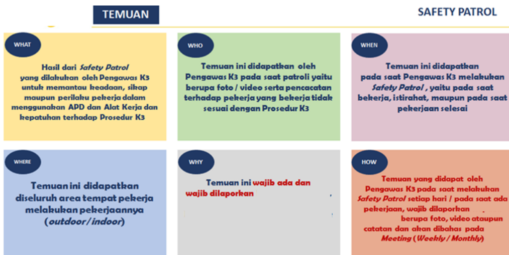
Gambar 3. 5W + 1H Safety Patrol

Safety Patrol Merupakan kegiatan patroli terhadap pelaksanaan K3 oleh pekerja disemua area kerja/lapangan oleh Pengawas K3. Area inspeksi meliputi seluruh area kerja/lapangan dengan mendokumentasikan temuan terhadap pelanggaran prosedur K3 oleh pekerja. Temuan dari hasil patrol akan dilaporkan pada grup whatsapp yang telah ditentukan dan dibahas dalam meeting weekly/monthly