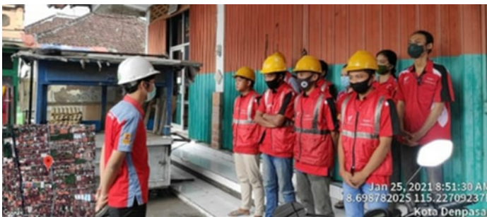
Gambar 8. Kegiatan Safety Briefing