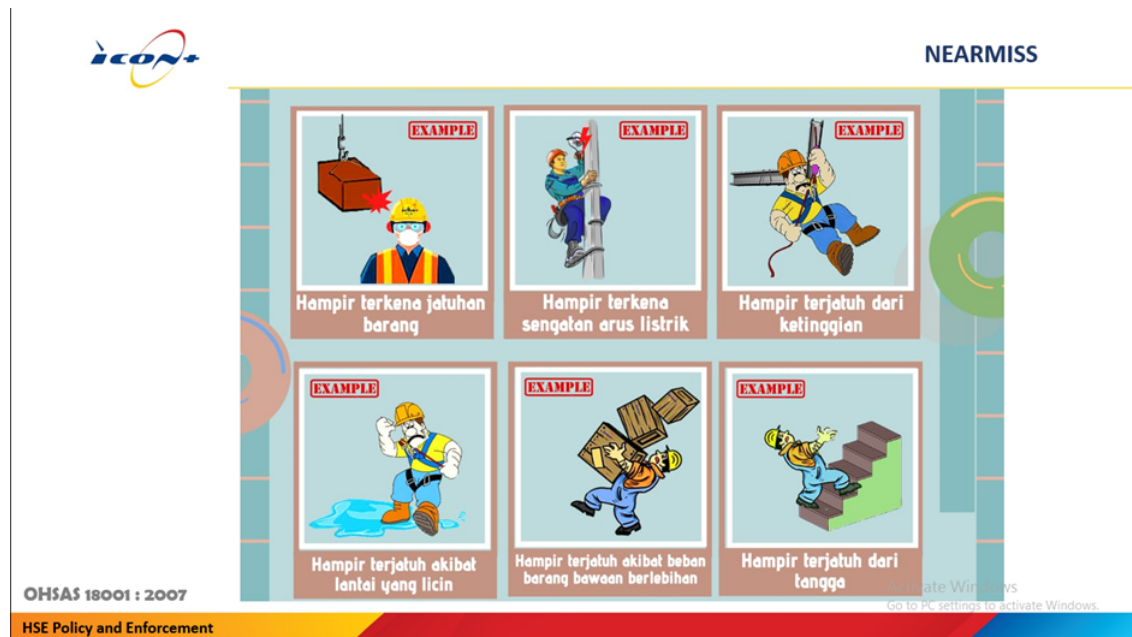
Gambar 5. Near Miss

Near Miss merupakan kejadian hampir celaka atau nyaris celaka oleh suatu peristiwa yang tidak direncanakan dan tidak mengakibatkan cedera, penyakit, atau kerusakan properti namun memiliki potensi untuk mengakibatkan kerugian-kerugian tersebut. Apabila menemukan kejadian Near Miss yang ada dilingkungan kerja, pekerja wajib melaporkan kepada pengawas K3.