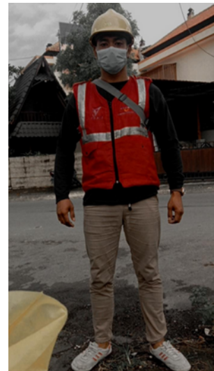
Gambar 2. Kelengkapan APD

Alat pelindung diri (APD) fungsi utamanya adalah untuk mengurangi akibat / resiko dari suatu kecelakaan. Pertimbangan Pemilihan Alat Pelindung Diri sebagai berikut :