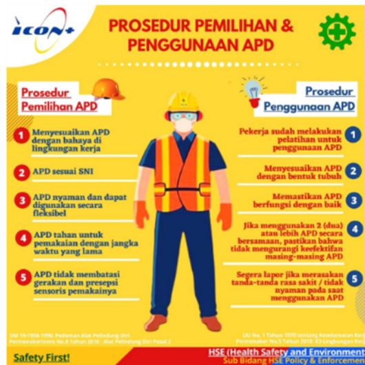
Gambar 1. Pemilihan dan Penggunaan APD

Adapun pemilihan dan penggunaan APD yang benar sebagai berikut :