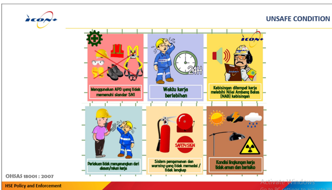
Gambar 7. Unsafe Condition

Unsafe condition adalah semua kondisi yang dapat membahayakan diri sendiri, orang lain, peralatan maupun lingkungan yang ada di sekitarnya. Dalam hal ini kondisi tidak ada aman disuatu tempat kerja sangat berpengaruh menimbulkan suatu kecelakaan, baik itu kecelakaan besar maupun kecelakaan kecil dan dapat menimbulkan kerugian yang sangat besar bagi perusahaan dan karyawan. Kesadaran akan potensi bahaya disuatu tempat kerja merupakan langkah pertama dan utama didalam upaya pencegahan kecelakaan kerja secara efektif dan efisien.