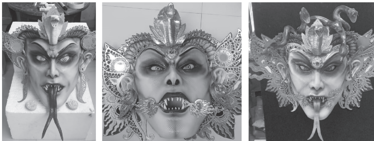
Gambar 5. Proses Pewarnaan Pada Topeng dan Ornamen

buatan detail dan pendempulan agar ukuran pola dasar topeng tidak berubah dan lebih mudah dibentuk karena kardus bahan yang lunak kerusakan pada pola dasar sangat mungkin terjadi ketika tidak dipegang sementara dengan kawat.