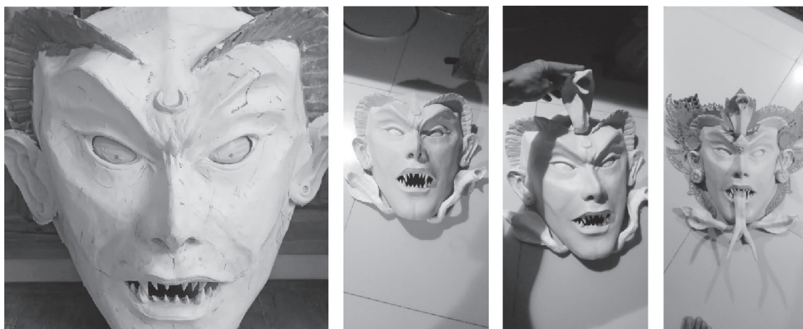
Gambar 4. Proses Penambahan Detail dan Ornamen Untuk Memperkuat Karakter Dewi Kadru

Pertama tama kardus akan dipotong sesuai kebutuhan dalam membentuk sebuah pola dasar dari sebuah wajah. Proporsi mata, hidung, bibir harus diperhitungkan dengan cermat. Tiap tiap potongan akan direkatkan dengan lem dan plester. Agar mempermudah perakitan dan ukuran tapel serta bentuk tapel tidak berubah setelah proses perakitan dan penempelan kardus, kita perlu menyiapkan kawat yang dibentuk menjadi oval mengikuti pola dasar bentuk sebuah wajah. Kawat ini akan berfungsi sebagai pegangan sementara terutama saat proses pem-