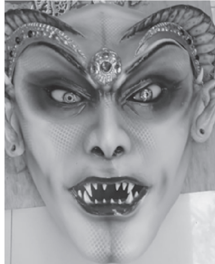
Gambar 7. Unsur Warna Pada Topeng Ogoh Ogoh Dewi Kadru