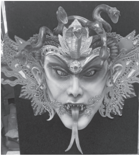
Gambar 6. Karakter Dewi Kadru Yang Memperlihatkan Penggabungan Unsur Bali dan Mitologi Yunani.