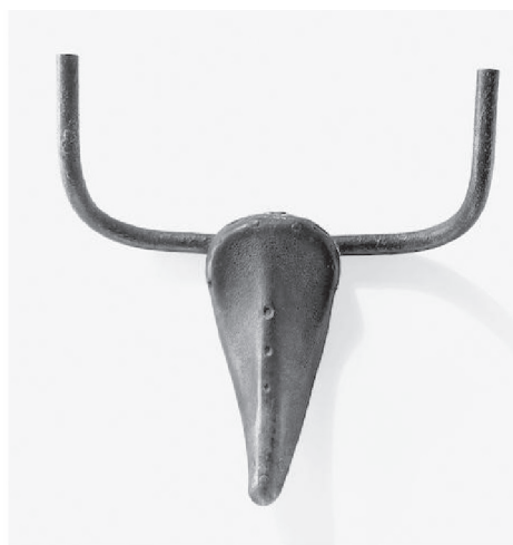
Gambar 1. (kiri) Karya Michel Ducham “Fountain dan (kanan) Karya Picaso Head Bull