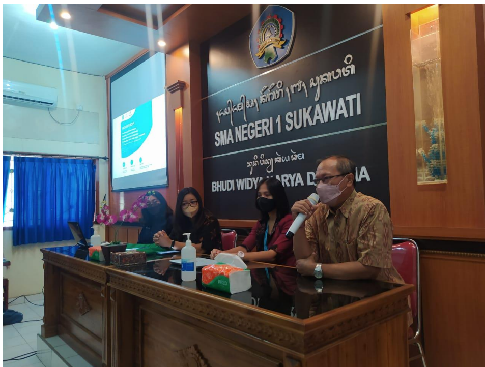
Gambar 2. Pembukaan Workshop oleh Wakasek Kurikulum

Workshop penggunaan LMS yang sudah dikembangkan dilakukan selama 3 hari dimulai dari tanggal 21-23 Desember 2022. Kegiatan dilaksanakan secara hybrid (luring dan daring). Kegiatan workshop diawali dengan pembukaan oleh Wakil Kepala Sekolah Bidang Kurikulum (Gambar 2). Workshop dimulai setelah penyerahan Manual Book (Petunjuk Penggunaan) LMS SMAN 1 Sukawati kepada pihak perwakilan Sekolah oleh Ketua Pelaksana Kegiatan (Gambar3).