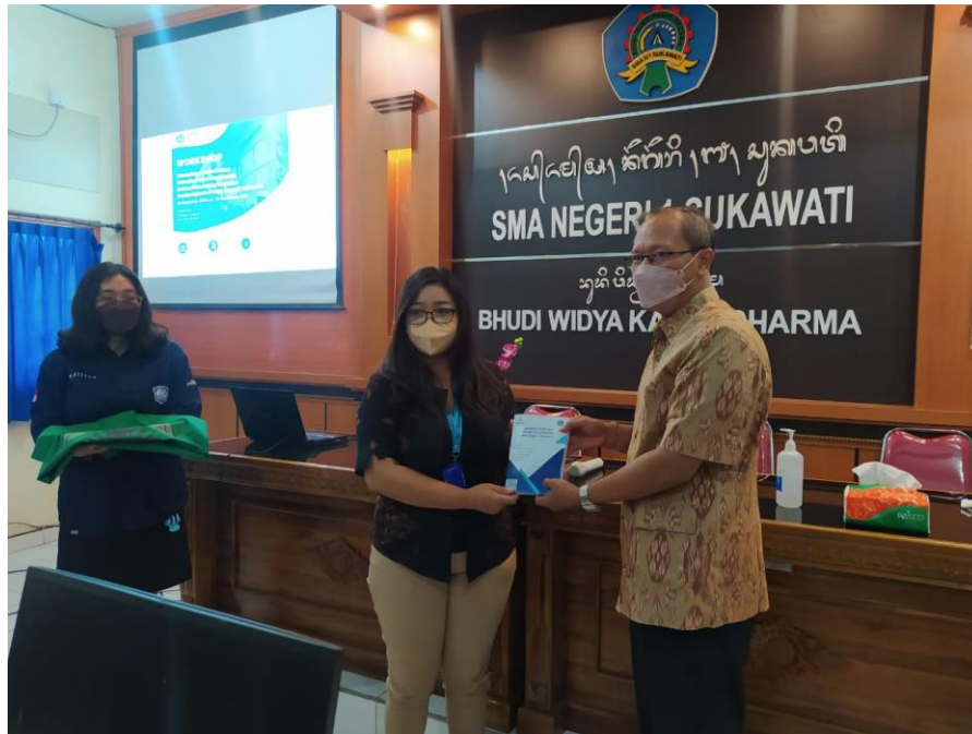
Gambar 3. Penyerahan Manual Book

Selanjutnya, guru-guru mendengarkan pemaparan materi workshop secara luring selama 8 jam (Gambar 4). Kemudian dilanjutkan dengan kegiatan daring selama 16 jam.