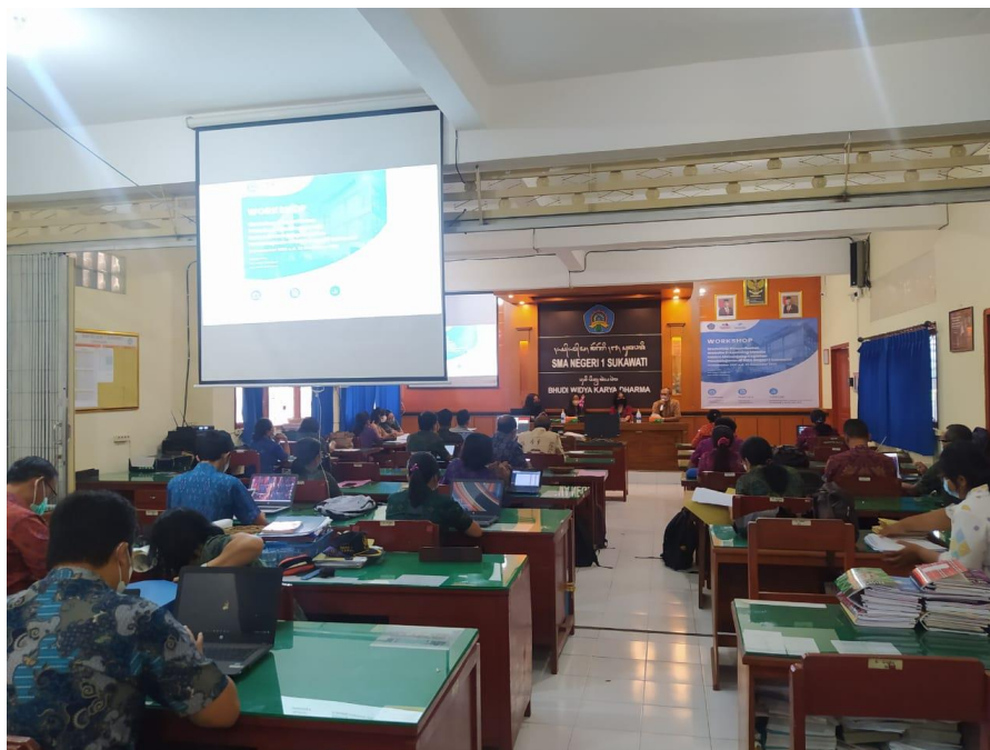
Gambar 4. Guru-Guru Mengikuti Kegiatan Workshop Luring

Selanjutnya, guru-guru mendengarkan pemaparan materi workshop secara luring selama 8 jam (Gambar 4). Kemudian dilanjutkan dengan kegiatan daring selama 16 jam.