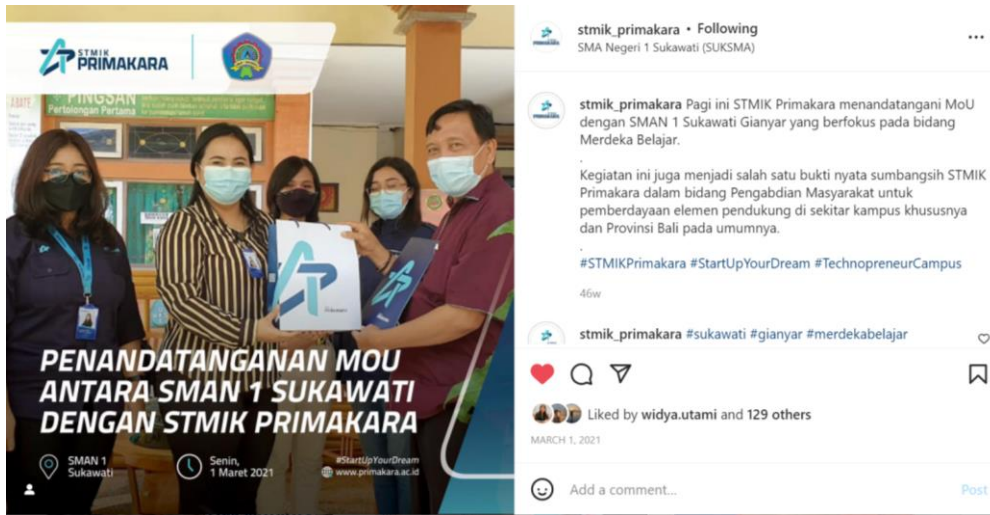
Gambar 1. Penandatanganan MOU

Workshop penggunaan LMS yang sudah dikembangkan dilakukan selama 3 hari dimulai dari tanggal 21-23 Desember 2022. Kegiatan dilaksanakan secara hybrid (luring dan daring). Kegiatan workshop diawali dengan pembukaan oleh Wakil Kepala Sekolah Bidang Kurikulum (Gambar 2). Workshop dimulai setelah penyerahan Manual Book (Petunjuk Penggunaan) LMS SMAN 1 Sukawati kepada pihak perwakilan Sekolah oleh Ketua Pelaksana Kegiatan (Gambar3).