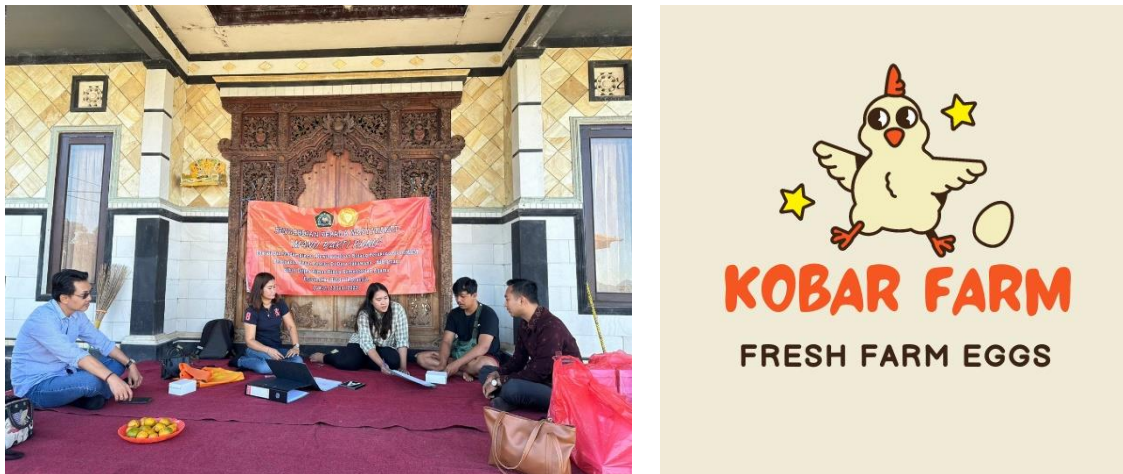
Gambar 1. Edukasi Pentingnya Pemasaran dan Brand Awareness