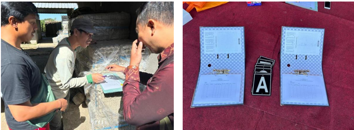
Gambar 2. Pelatihan Pencatatan dan Pembukuan

teratur sehingga tidak dapat memperkirakan berapa omzet penjualannya dengan tepat. Maka dari itu diperlukan pembinaan dan pelatihan untuk melakukan pencatatan dan pembukuan sederhana bagi Kobar Farm untuk dapat mencatat kegiatan produksi dan penjualan setiap periodenya,