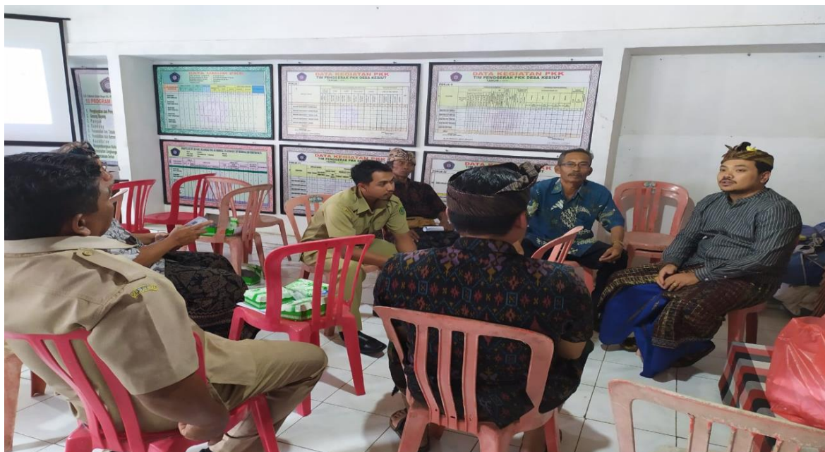
Gambar 3.1 (b) Aktifitas Edukasi dan diskusi terbatas tentang pentingnya penggunaan Teknologi Informasi pada kegiatan usaha