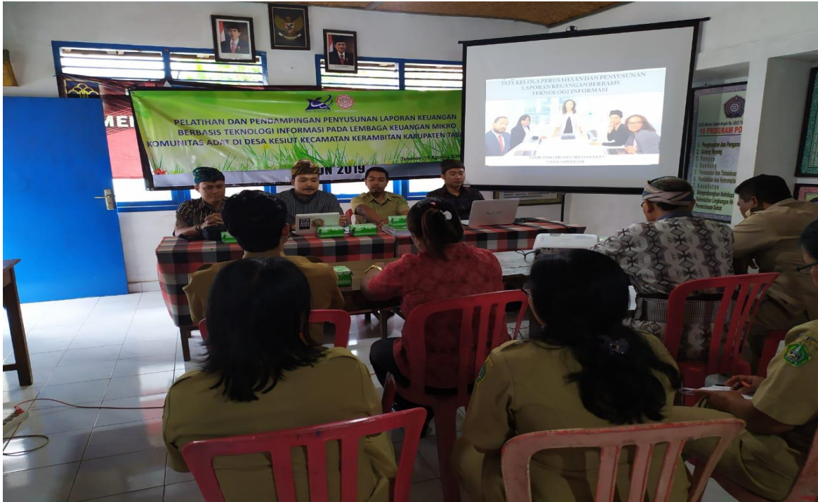
Gambar 3.1 (a) Pemaparan Materi Sosialisasi