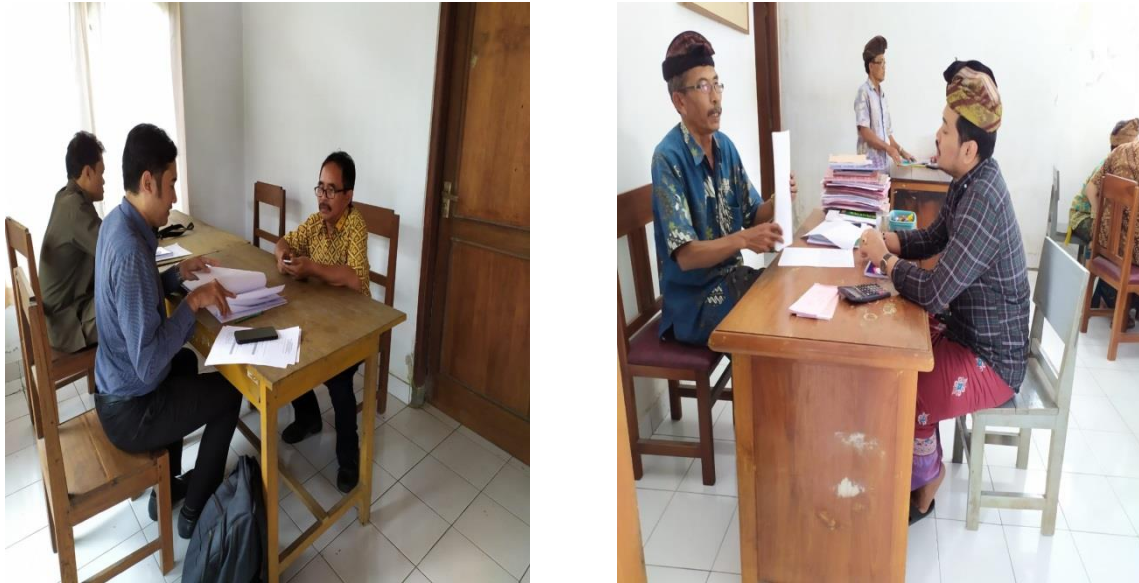
Gambar 3.4 Aktivitas Tim Pelaksana dalam memberikan edukasi/tutorial dalam merencanakan anggaran bagi Mitra Sasaran