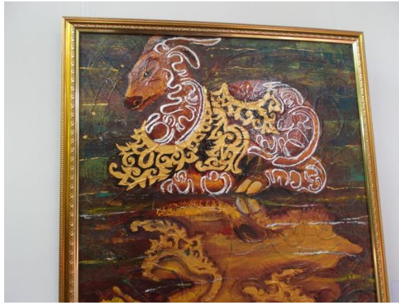
Judul :Sila Suluh Siwi Sastra Sundar Sundur Pelukis : I Dewa Made Dwipayana Putra, SS Koleksi Pameran Tetap Museum Seni Lukis Bali Klasik Nyoman Gunarsa, Klungkung-Bali

Baligrafi berwujud manusia-manusia purba yang sangat primitif dan karakter sangat sederhana, tampak anggun mengesankan dan berwibawa. Keberadaan seni baligrafi seperti wujud manusia ini sering dipergunakan dalam simbol upacara yadnya di Bali. Baligrafi berwujud pepohonan, karakter pepohonan menjadi seni baligrafi seperti pohon kelapa, papaya yang mengandung unsur rupa dan lain-lain.