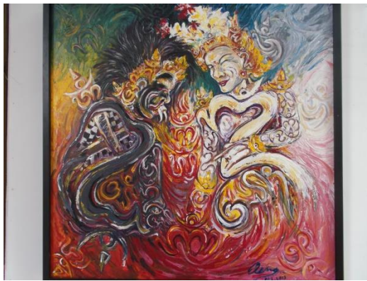
Barong Landung Lanang Istri

Pelukis : Agung, Koleksi Museum Seni Lukis Bali Klasik Nyoman Gunarsa, Klungkung-Bali