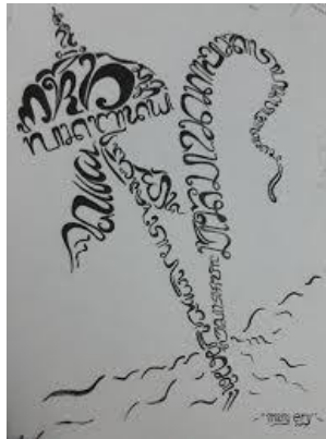
Judul : Rajegang Bahasa lan Budaya Baline

Baligrafi berwujud simbol-simbol Hindu. Simbol-simbol Hindu diolah menjadi karya seni yang kreatif dengan menggunakan aksara Bali sebagai media. Simbol ini menandakan berbagai bentuk simbol sarana acara agama. Contoh :