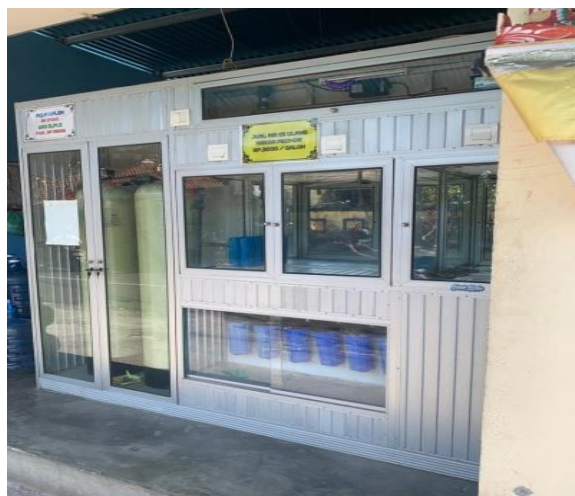
Gambar .4 Kondisi DAMIU 5 di Kecamatan Sukawati, Kabupaten Gianyar, Provinsi Bali.

yang tidak berdiri sendiri dan bergabung dengan tempat aktivitas lain hal ini memungkinkan terjadinya pencemaran dari lingkungan sekitar. Kebersihan depot harus selalu terjaga untuk menghindarkan kontaminasi.