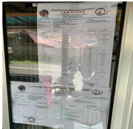
Gambar 2 Hasil Analisa Laboratorium Air Baku DAMIU 3

tersebut dibuktikan dengan adanya hasil analisa laboratorium yang menempel pada kaca DAMIU yang menyatakan air tersebut layak digunakan sebagai bahan baku air minum isi ulang.