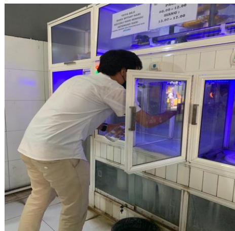
Gambar 3 Proses Pengambilan 6 DAMIU di Kecamatan Sukawati, kabupaten Gianyar, Provinsi Bali

Proses pengolahan air baku menjadi air minum isi ulang pada 6 DAMIU di Kecamatan Sukawati, Kabupaten Gianyar, Provinsi Bali melalui tahap-tahap penyaringan yang sama yaitu: 1. Penyaringan bertahap terdiri dari saringan pasir atau saringan lain yang efektif dengan fungsi yang sama. Fungsi saringan pasir adalah bertujuan untuk menyaring partikel- partikel kasar. Bahan yang digunakan adalah butir- butir silika minimal 80%. Saringan karbon aktif yang berasal dari batu bara atau batok kelapa berfungsi sebagai penyerap bau, rasa, warna, sisa khlor dan bahan organik. Saringan atau filter Catrige berfungsi sebagai saringan halus berukuran maksimal 10 mikron. 2. Filter UV atau Ozon berfungsi sebagai desinfeksi untuk membunuh kuman-kuman pada produk air minum.