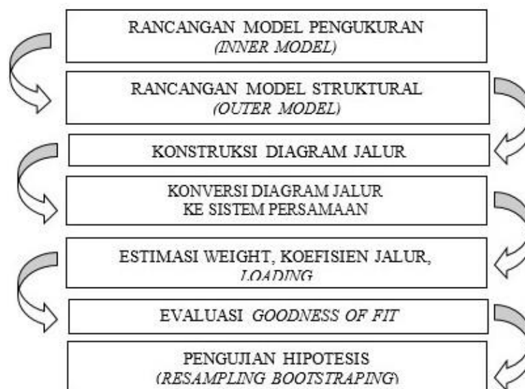
Gambar 1. Tahapan Analisis Partial Least Square (PLS)

Ghozali (2013) menjelaskan bahwa PLS adalah metode analisis yang bersifat soft modeling karena tidak mengasumsikan data harus dengan pengukuran skala tertentu, yang berarti jumlah sampel dapat kecil (dibawah 100 sampel). Perbedaan mendasar PLS yang merupakan SEM berbasis varian dengan LISREL atau AMOS yang berbasis kovarian adalah tujuan penggunaannya. Menurut Jaya dan Sumertajaya (2008) langkah-langkah dalam penggunaan Partial Least Square yang lazim dilakukan adalah sebagai berikut (gambar 1).