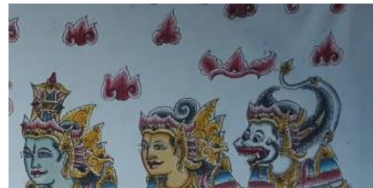
Gambar 4. Kepala pada Seni Lukis Wayang Korpang

bentuk kepala dari Seni LukisWayang Korpang dihiasi Rupa Pewayangan Manusia Memanisan, Lelembutan, Dewa Dewi , Binatang, Raksasa dlll Yang Memanjang Keatas dlll, Dimana Wajah Dihiasi Dengan , berbagai Mata lembut dan Manis, Dedelingan, alis Madon Intaran dan kedewataan, hidung Mancung serta mulut kekerasan dan memanisan. Mahkota Kepala yang lengkap seperti tetindikan, Petitis, Ron Ron,Rambut, Gelungan ,Cecandian ,Geruda mungkur dlll