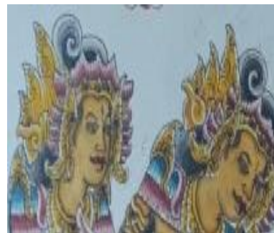
Gambar 5. Mahkota pada Seni Lukis Wayang Korpang(dok. Pribadi)