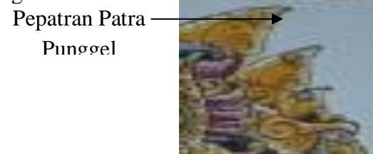
Gambar 11. Papatran Parta Punggel pada Gelungan Candi karya IB Ketut Suta

Pepatran adalah ragam hias yang dibuat dari wujud tanaman secara utuh kemudian distilir sedemikian rupa menjadi sebuah karya seni berupa pengulangan, baik secara melingkar/lurus yang dikenal dengan nama pepatran. Salah satu motif patra adalah patra punggel yang mengambil wujud dasar liking paku, sejenis flora dengan lengkung-lengkung daun muda pohon paku (Dwijendra, 2010:165-167). Dalam Seni Lukis Wayang Kopang seperti Papatran patra punggel ini terletak pada bagian hiasan gelungan yang dikombinasi dengan ron ron dan geguakan Untuk mengetahui lebih jelas tentang pola patra punggel dapat dicermati pada gambar Dibawah ini :