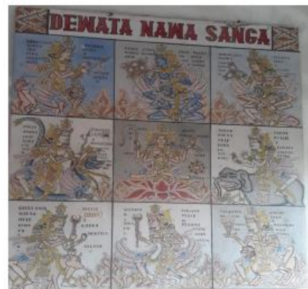
Gambar 2. Dewata Nawa Sanga, karya IB Suta