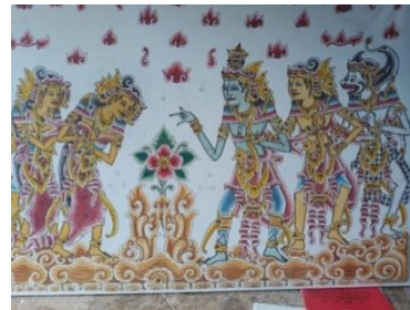
cGambar 1. Seni Lukis Wayang Kopang karya IB Suta (dok. Pribadi)