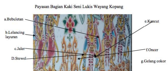
Gambar 9. Nistaning Nista (kaki) pada Seni Lukis Wayang Kopang(dok. Pribadi)